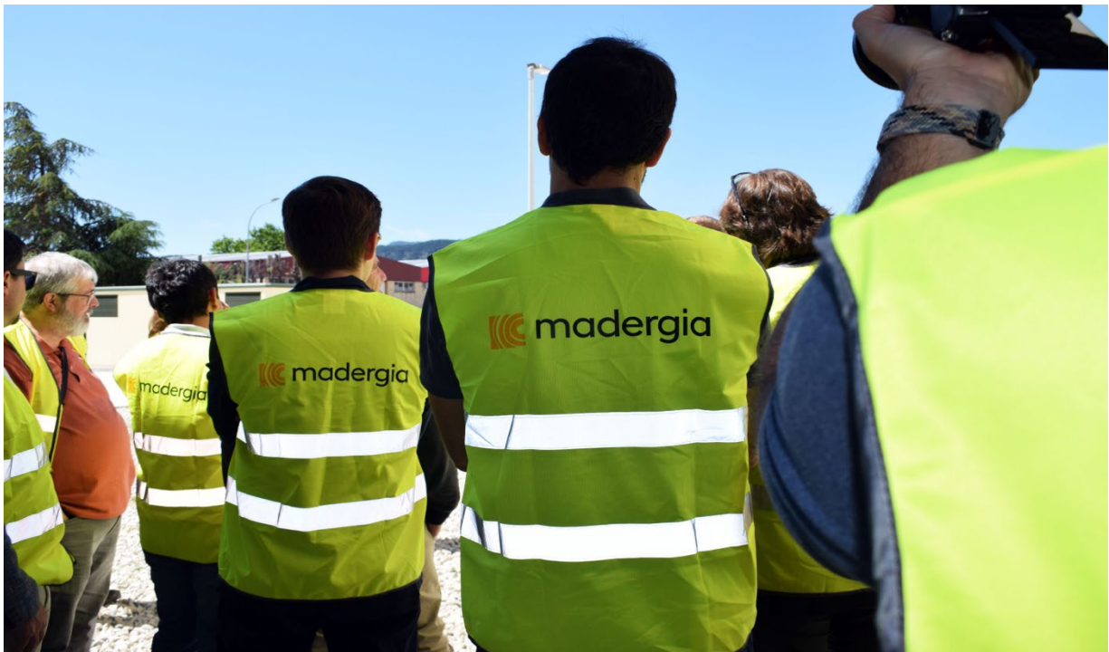
Visita a la fábrica de Madergia en Aoiz (Navarra)

Durante dos días el Fórum ha combinado ponencias técnicas del más alto nivel, visitas a instalaciones productivas y mesas de debate. El programa comenzó con una visita al centro de producción de Madergia en Aoiz (Navarra) , que mostró líneas avanzadas de prefabricación de elementos estructurales y cerramientos con alto grado de terminación. Los participantes pudieron conocer cómo se transfieren los modelos digitales desarrollados en oficina a la maquinaria de control numérico para el mecanizado de piezas.