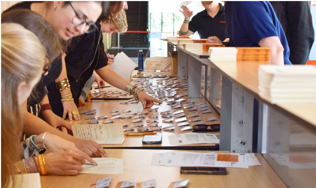
Fórum Internacional de Construcción con Madera 2026 | Imagen: Fórum Madera – Hexágono blanco